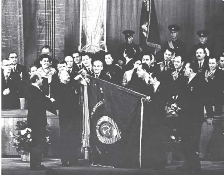
Вручение ордена Дружбы народов, 1974 год

90 лет назад, в январе 1934 года, вышло Постановление Центрального исполнительного комитета Союза ССР о награждении орденом Ленина ряда краёв и областей. Список отличившихся возглавила Кабардино-Балкарская автономная область. Такую высокую награду могли вручить исключительно за выдающиеся заслуги. И таковые, безусловно, имелись.