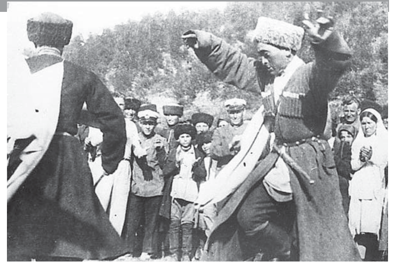
Народные гулянья, май 1934 года