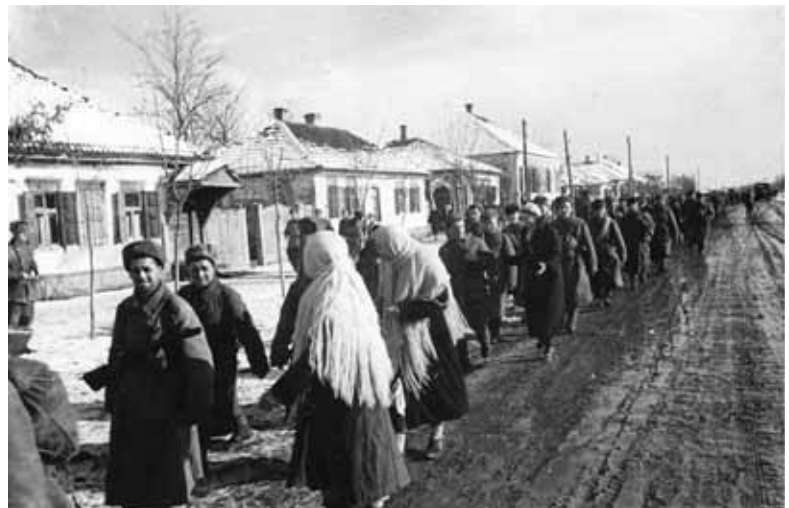
Части Красной армии проходят по г. Прохладному, освобождённому от гитлеровских захватчиков в январе 1943 г.

Помогали жители Кабардино-Балкарии и денежными средствами, которые шли на создание военной техники. В сентябре 1941 года молодёжь Нальчикского мясокомбината начала сбор средств на постройку авиазвена истребителей «Комсомолец Кабардино-Балкарии». Несколько танковых колонн было создано на деньги жителей республики: дорожники собирали средства на колону «Боевой дорожник», учителя школы № 6 города Нальчика – на «Народный учитель», а учащиеся школы № 1 – на колону «Советский школьник». Помимо этого, были направлены денежные средства на строительство танковой колонны «Колхозник» орденосной Кабардино-Балкарии от жителей Шалушки и колонны «Смерть немецким захватчикам» от трудящихся республики.