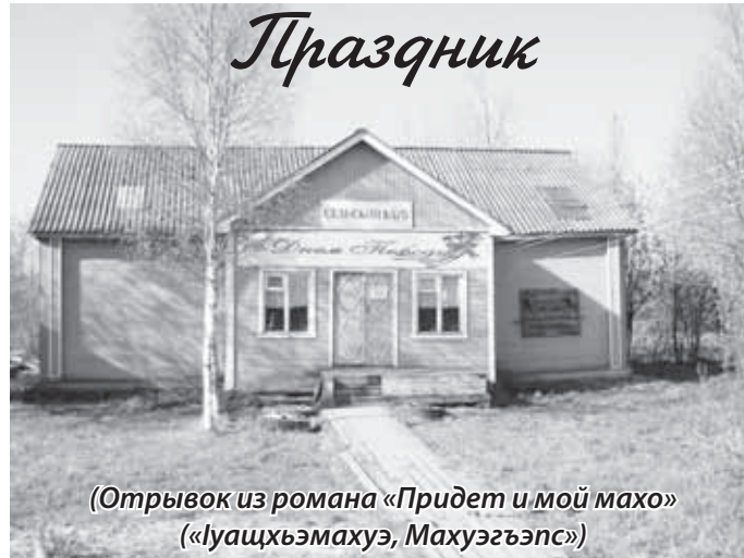
(Отрывок из романа «Придет и мой мах» («Йуащхэмахуз, Махузгъэпс»))

- Ты ведь рисованию учишься? – Роза подходит совсем близко, она не сменила