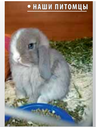
• НАШИ ПИТОМЦЫ

Когда она на руках, не старается улизнуть, даже может заснуть, если ее не беспокоить. Но переезд к нам перенесла тяжело, первую неделю никак не могла привыкнуть. В первый день мы, наверное, испугали ее избытком внимания, постоянно доставая из клетки, чего категорически нельзя было делать. Синеглазка привыкала с трудом к новым запахам, к новой клетке, звукам и к нам, но теперь она полноценный член семьи.