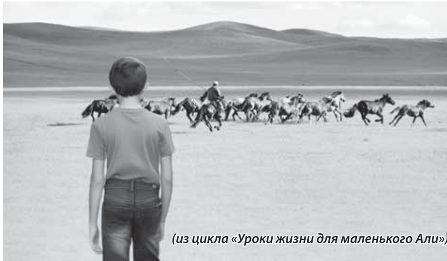
(из цикла «Уроки жизни для маленького Али»)

Человечество состоит из иерархий. Так устроена каждая единица социума - она ищет свое место в обществе, чтобы знать ориентиры. Касым точно знал свое место и терпел все последствия. Ему нужна была работа, чтобы кормить престарелую