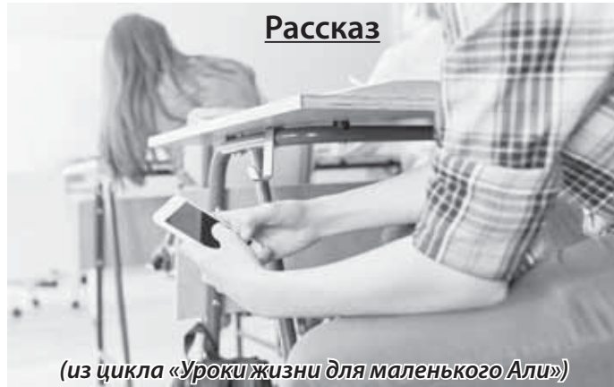
(из цикла «Уроки жизни для маленького Али»)

Осень в этом году была особенно солнечной и теплой. Казалось бы, наступила пора дождей, а дни один за другим шли ясные. Школьникам было трудно сидеть на уроках, в том числе и Али. Он с нетерпением ждал перемены, чтобы убежать с друзьями во двор бросаться охапками листьев и прыгать в желто-красные «сугробы». Они всей школой сгребали сухие листья в прошлую субботу, и пока дворник не сжег эти охапки, детвора играла вволю. В классе Али ни у кого не было смартфонов, пока его друг Хасан однажды утром гордо не вошел в класс с черным прямоугольником в заднем кармане брюк. Неспешно повесил ранец на крючок, достал учебник и сверху положил телефон, словно всегда делал так. Класс тут же сгрудился у его парты, всем хотелось посмотреть, какой телефон у Хасана. Мальчик с довольным видом отвечал на вопросы и каждому дал посмотреть его и посмотреть. Али тоже был в числе любопытных. Когда до него дошла очередь полюбоваться телефоном друга, с искренним восхищением покрутил его в руках, восклицая: