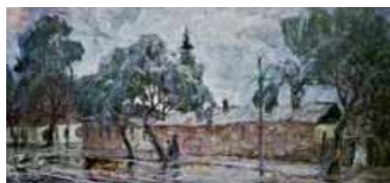
В. Кочергин. «Дожливый день»