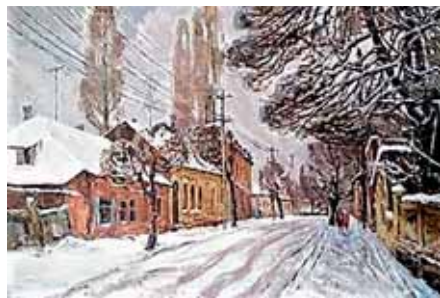
В. Кочергин. «Улицы Свободы»

Глядя на работы живописца, видишь, какое большое значение он придавал пространственному построению картин и передаче световоздушной среды. Композиция картины «Дожливый день» с ее линейно-ритмическим строем и точно найденным колористическим решением, несомненно, соответствует подсказанной ситуации самой жизнью. В картине «Нальчик. Старая Октябрьская» возникает образ тихого уютного городка, буквально утопаю-