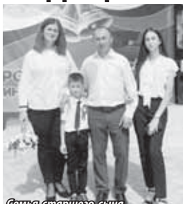
Семья старшего сына