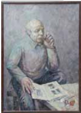
А. Дзагалов. «Память», 2005 г.

Фестиваль дает прекрасную возможность погрузиться в мир искусства, обменяться опытом и получить заряд эстетического удовольствия. В центральных залах музея экспонируются произведения искусства талантливых художников разных времен, стилей и направлений - жанровая живопись, портреты, пейзажи, графика, светопись, скульптура, керамика, предметы ювелирного искусства, созданные начиная с 1901 года и до наших дней. Для любителей изобразительного искусства организаторы подготовили лекции, экскурсии, мастер-классы, творческие вечера от известных деятелей мира искусства.