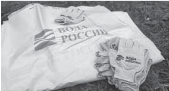
Одно из первых значимых мероприятий акции «Вода России», основная цель которой – очистка берегов водных объектов от мусора, прошла в Кабардино-Балкарии. Акция является частью федерального проекта «Сохранение уникальных водных объектов» национального проекта «Экология».

Говоря о мерах социальной поддержки учителей, министр сообщил, что в планах – устойчивый опережающий рост заработной платы педагогических работников. Отвечая на вопросы депутатов, коснулся проблемы перехода школ республики на однодневный режим работы. Сообщил, что более всего перегружены школы Нальчика, изменить ситуацию сможет ввод новых школ по периметру городского округа.