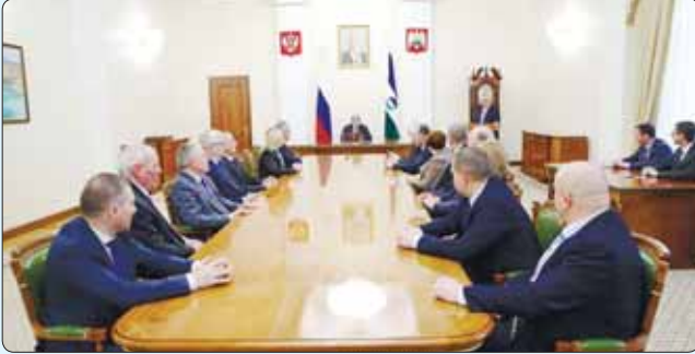
Республикэм и унафэщІ КІуэкІуэ Казбек иужь махуэм зэлүщІэ зыбжанэ иригъэкІулэлаш:

КЪБР-м и Іэтащхьэ КІуэкІуэ Казбекрэ КЪБР-м и Хэхакулэ комиссэм хэтхэмрэ зэхуэзэри, Іэлэтым кырикІулэхэр кѡапщІэжакъ.