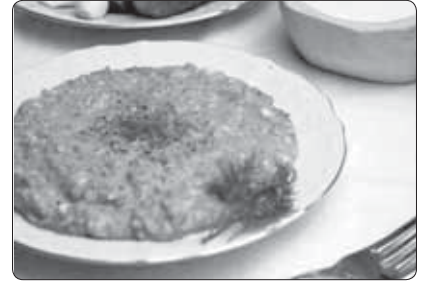
шыбжыйуэ, джэдгыну - узыхуейм хуэдиз. «Адыгъ шхынкъэр» тхылым къытхыжаш.

Халхъэжэр (цыхуитӀ лыхъэ): джэщ - г 200, псыуэ - г 1450-рэ, бжыны укьэбзауэ - г 30, тхуэуэ - г 60, шатэу - г 160-рэ, шыгъуу,