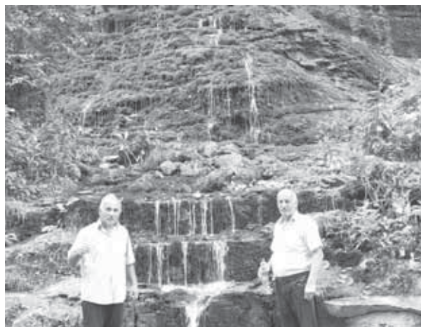
Бетни ОСМАНЛАНЫ Хейса хазырлагьанды.

Алгьаракьда мен да болдум алайда. Кьол-бет да жуудум, ууучум бла алып, суусабымы кьандырдым. Кьаяла тузагында турган кьызыны көз жашларына кьарап, көп сагыш этдим. Журтубузну тамаша жерлеринден уллу зауукьлукь алып, ызыма жол салдым.