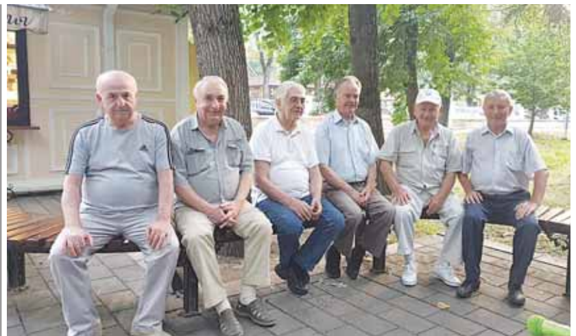
Кѳнденчилени Нальчикни ара паркында ныгышлары.