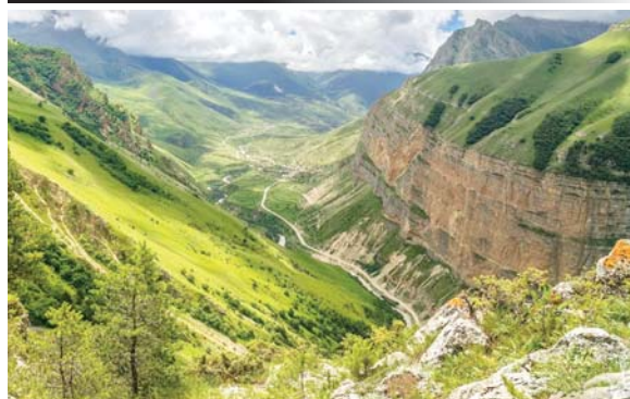
Суратны ХОЛАЛАНЫ Марзият алгъанды.