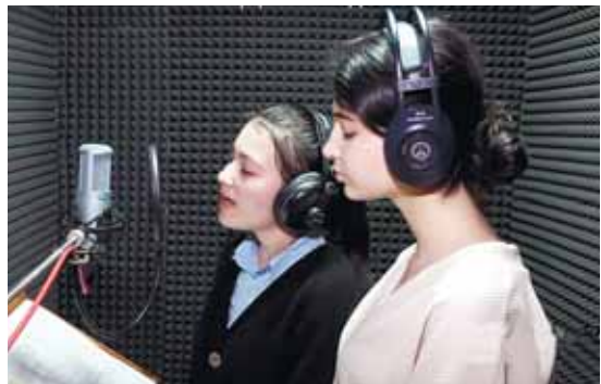
Жыр жаздырыу арада.