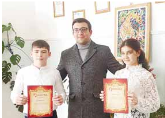
Докаланы Юсюп юйретген сабийлери бла.