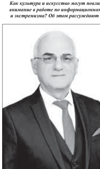
Как культура и искусство могут повлиять на молодежь, на что стоит обратить внимание в работе по информационному противодействию идеологии терроризма и экстремизма? Об этом рассуждают деятели искусства и работники культуры.

Хочу отметить, что, вопреки расхожему мнению, молодежь у нас сегодня просто замечательная. Они активные, увлеченные. Я вижу, сколько работы проводится с молодежью, начиная со школьной скамьи. Это и движение школьников, и РДМ, студенчество, есть парламентская Молодежная палата, скоро возобновит свою работу Молодежное правительство. Наша молодежь ставит перед собой большие цели и уверенно движется к