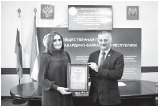
Заседание Общественной палаты Кабардино-Балкарии.

Две комиссии Общественной палаты КБР – по развитию институтов гражданского общества, гармонизации межэтнических и межконфессиональных отношений, развитию некоммерческого сектора и по развитию культуры, сохранению духовного наследия и средств массовой информации – обсудили в формате круглого стола роль общественных объединений в укреплении духовно-нравственных ценностей, сохранении и популяризации народной традиционной культуры в молодёжном среде.