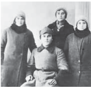
Кампания «Пальто – горняк», на фото девушки в новых пальто