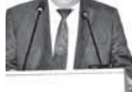
ционно-рекламной сферы. Их ключевой задачей, в том числе специалистами для центра компетенции, должны быть озадачены учёные Кабардино-Балкарского государственного аграрного университета им. В. М. Кокова.

Важно рассмотреть возможность для начинающих кооперативов предусматривать на федеральном уровне (соответственно для всех субъектов РФ) некие налоговые преференции, освобождая эффективные экономические и социально значимые потребительские кооперативы от уплаты налогов, к примеру, в течение 10 лет от уплаты налога на прибыль от функционирования. Или же предоставить им на стартовом этапе возможность бесплатно подключиться к коммуникациям, в том числе энергетическим и водопроводным сетям. Нужно в этих кооперативах иметь профессиональных управленцев, специалистов в области менеджмента, логистики и информа-