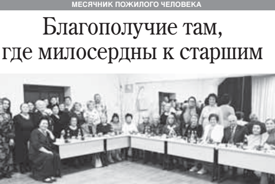
Завершился месячник пожилого человека. В октябре государственными, муниципальными и общественными организациями традиционно много внимания было уделено людям серебряного возраста. Одним из мероприятий этого периода стал вечер «Благополучие там, где милосердны к пожилым», проведённый общественной организацией г.о. Нальчик «Совет женщин» в рамках проекта «Сохраняем семейные ценности, защищая будущее», поддержанного администрацией столицы республики.

ков-архивистов, заслуженный работник культуры КБР. 7 ноября 1963 г. — в селении Янкой торжественно открыт памятник Герою Советского Союза А.Ю. Бакуняну. 10 ноября 1943 г. — родился Омар Мимболатович Этезов — прозаик, один из первых балкарских драматургов. 27 ноября 1938 г. — принят в эксплуатацию автовокзал на улице Б. Пачева в Нальчике. Ноябрь 1973 г. — вступил в строй санаторий «Нальчик». Ноябрь 1993 г. — начала выходить газета «Горняк».