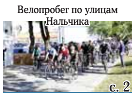
Велопробег по улицам Нальчика

Учредители: Парламент и Правительство КБР