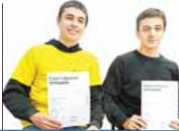
Деять школьников получили сертификаты Яндекс.Лица