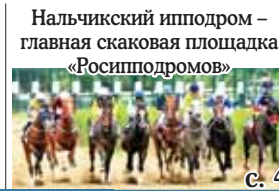
Нальчикский ипподром – главная скаковая площадка «Росипподромов»