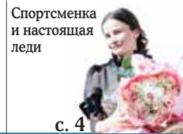
Спортсменка и настоящая леди