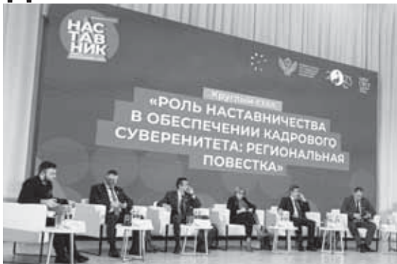
В школе №33 г. Нальчика 2 и 3 ноября прошла вторая выездная сессия в рамках Всероссийского форума наставников-2023. Проводится он в рамках объявленного в этом году Года педагога и наставника.