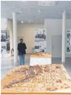
Приуроченную к Дню государственности республики экспозицию в выставочном павильоне парка столетия кураторы назвали «Городские летописи».

Посетителям предлагают вспомнить значимые события из истории становления Нальчика и сопоставить впечатления о современном облике города. Инициаторы проекта обратились к фото- и видеоархивам, воспоминаниям горожан, а также к