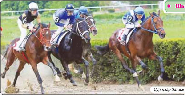
Сурэтхэр Уэлджэр Артур трихаш.