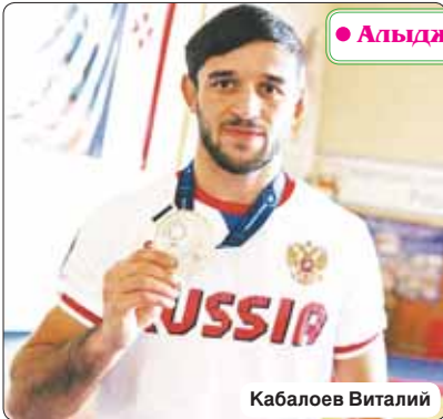
• Алыдж-урым бэнэкIэ

ТЕКИУЖЫ Заретэ. Суртыр Къарей Элинэ трихаш.