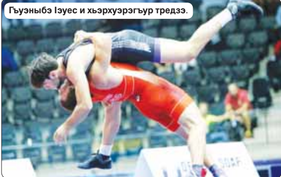
Гуэуныбэ Iэуес и хьэрхуэрэгъур тредзэ.