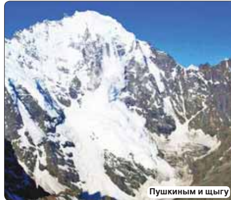
Пушкиным и щыгу