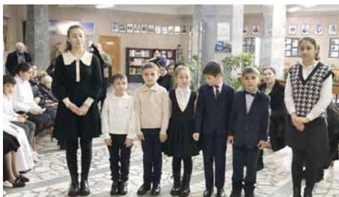
31-чи школну окууучулары.