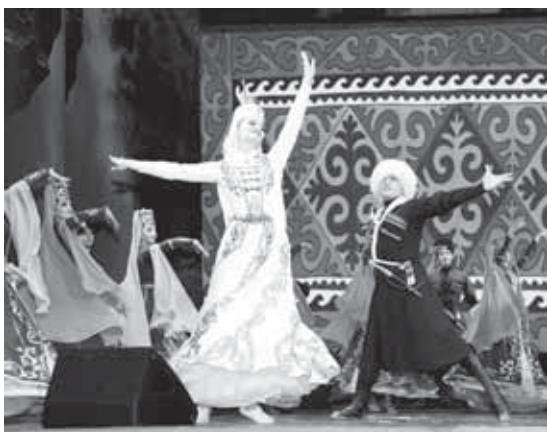
Ахыры. Аллы 1-чи бетдеди.