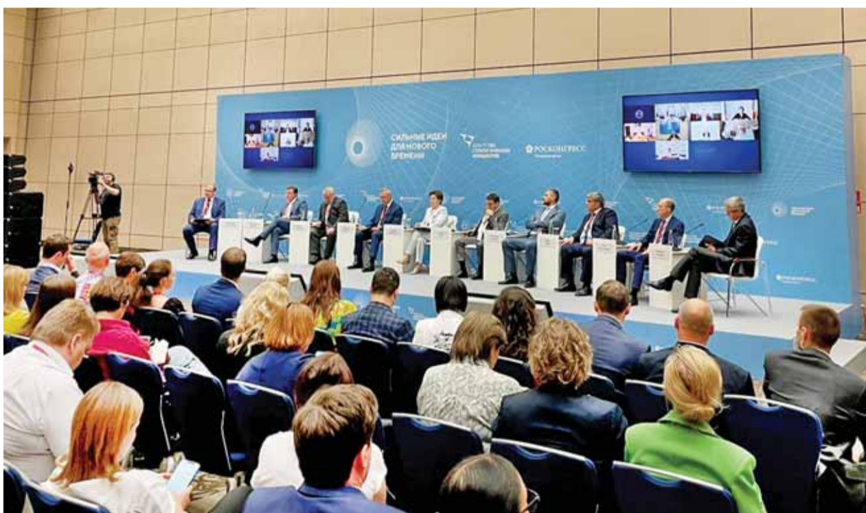
башха регионланы оночулары бла бирге губернаторланы Башламчылыклагга себеплик этиу эмда аланы жашауда бардыруу жаны бла клубларыны жыйылууна кыатышханды. Анда сёз россейли субъектлени социал-экономика айныуларын терклендирерге боллукъ инновациялы

Москвада «Жангы заманга кючлю башламчылык» деген экикюнлюк форум этгенди. Аны Стратегия башламчылыклары агентствосу бла Росконгресс фонд кырагандыла. Форумну пленар сессиясына уа Россей Федерацияны Президенти Владимир Путин кыатышханды. «Бизни экономикабызны, кырал бюджетибизни, бизнесибизни да узакъ болжаллы борчлары тамамларгга битеу онлары бардыла. Айныу жаны бла биз 2030 жылгга дери белгилеген миллет муратларыбызгга жетерге керекбиз. Шендою чырмаула эмда ала бизге ачхан онгла бизни бютюн бирикдирерге керекдиле. Биз битеу акылыбызны ма бу затлагга бурургга тийишлибиз: белгиленген муратлагга жетерге, инсанларыбыз кыайгырыубузну сезерча этерге», - деп айтылады кырал башчыны алгышлау сезюнде. Форумну чеклеринде КЪМР-ни Башчысы Казбек Коков Стратегия башламчылыклары агентствосуну чакырыуу бла