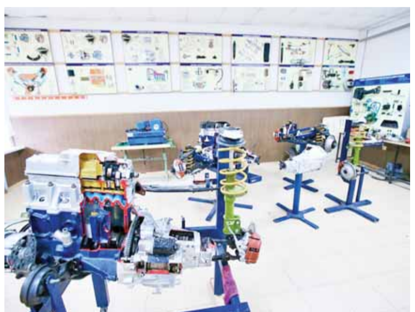
кабель ызланы хайырланыу», «Электромонтаж», «Графический дизайн», «Кыутаруу ишле», «Листовой металлны жарашдыруу», «Сварка иш», «Тигилген затланы компьютер моделированиясы», «Эстетикалы косметология», «Аш хазырауу иш» эм «Моданы технологялары» ызлада 11 мастерской кыраллыкды. Жангы

Орта профессионал билим беруу социал политиканы магъаналы ызларыннан бири болады. Къабарты-Малкъарны орта профессионал билим берген махемелеринде экономиканы башха-башха бёлюмлеринде ишлерик даражалы специалистлени хазырайдыла. Республикада КЪМР-ни Минпросвещениасыны 9 колледжи, федерал вузланы 7 колледжи эм 3 энчи иели колледжи ишлейдиле. Аланы мурдорларында «Билим беруу» миллет проектти «Жаш профессионалла» федерал проектине кере мастерскойла кыраладыла, алада жаш тёлю ишленген усталыклагга юйрениди. Мастерскойла WorldSkills стандартлагга кере шендоюлю оборудование бла жалчытылыныдыла, окутууну болумлары уа производстволуга жуукъдула. Быйыл регионда «Релейный кырауулануу эм автоматика оборудованианы обслуживаниасы эм ремонт», «Электропередача