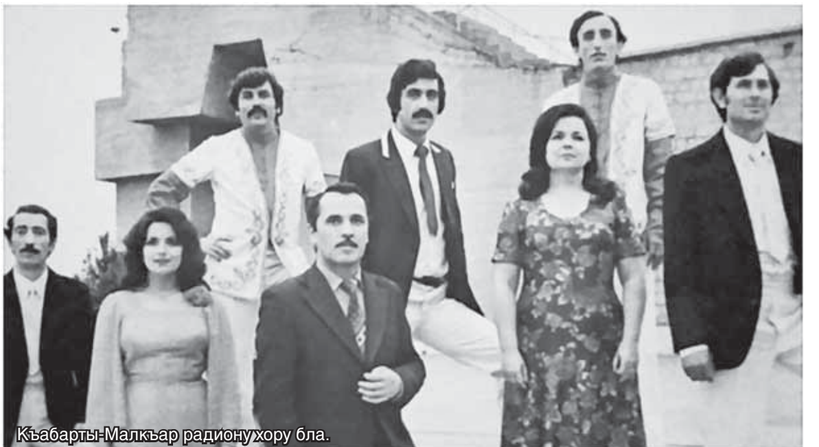
Кьабарты-Малкьар радиону хору бла.

Ююр тамата Апон а, сюрюгюнден кьайтханлай, Севкавэлектрприбор заводха кирип, анда алгьа токарь, ызы бла мастер, тамата мастер, производство-диспетчер бю-