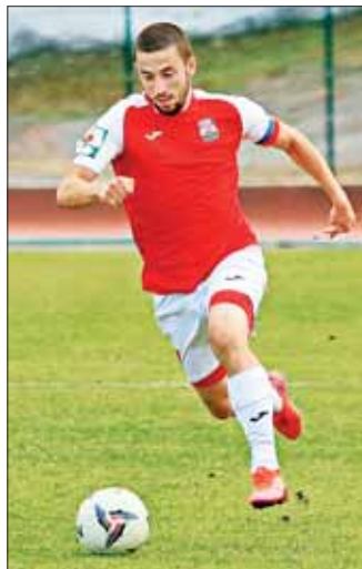
ей-2», а еще трое – за домашнее поражение от «Биолога-Новокубанска» со счетом 0:1.

Равное количество голосов было отдано и при определении худшего матча команды. Трое представителей СМИ проголосовали за домашнюю ничью с владикавказской «Алани-