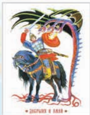
«ДЯСЛЫХ И ЗАСА»