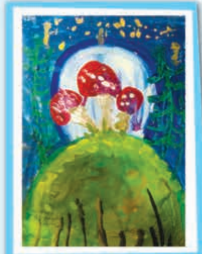
Савелий МУРЗАХАНОВ, 5 лет, студия «КармоАрт», г. Нальчик