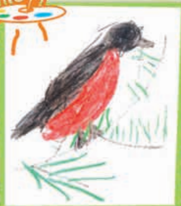
Милина КОЧЕСОКОВА, 5 лет, г. Нальчик