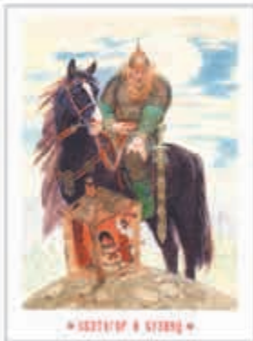
«ИЗТОП И СТОН»