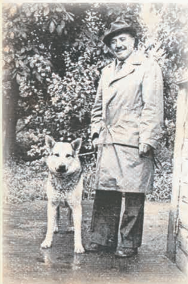
Къули Къайсын парийи бла. 1980 жыл.