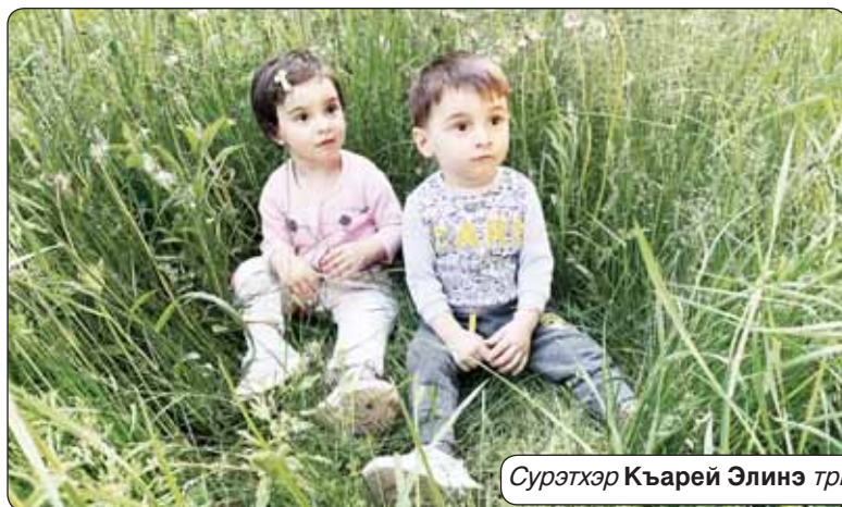
СурӀтхэр Къарей ЭлинӀ трихӀащ.

ГуцӀм и хъыринӀм УӀщӀлӀу зыгъӀпсӀху, ЖейкӀӀ зыбгъӀнщӀлауэ ЗыкъызӀбгъӀщӀлӀху. ЛӀу-лӀу, си нӀ пӀащӀу СӀ си щӀлӀлӀ нӀху, Гурыгъузу сӀлӀр Си гум изыгъӀху.