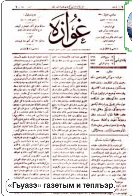
«Гъуазэ» газетым и теплэр.