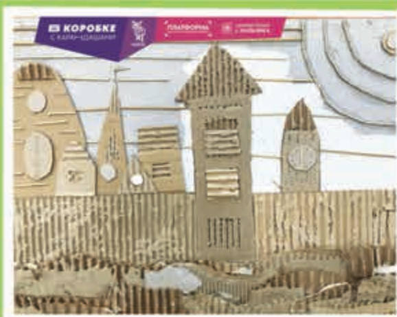
Замок. Марк ТИЩЕНКО