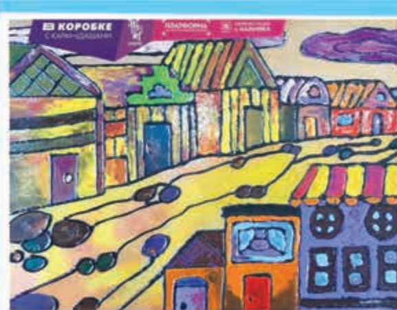
Город. Динара БЕТУГОНОВА