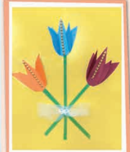
Камилла ТАМАЗОВА, 2-й кл., прогимназия № 66/1, г. Нальчик