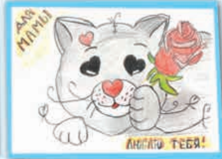
Милана ЖАМУРЗОВА, 2-й кл., прогимназия № 66/1, г. Нальчик