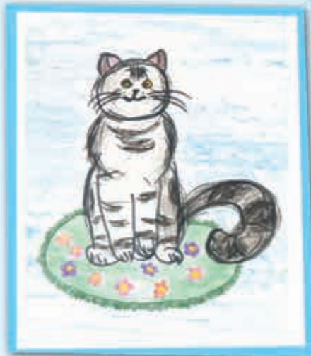
Амир МАТУЕВ, 2-й кл., прогимназия № 66/1, г. Нальчик