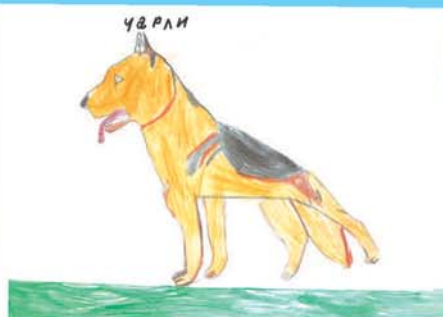
Русалина ХАПЦЕВА, 2-й кл., прогимназия № 66/1, г. Нальчик