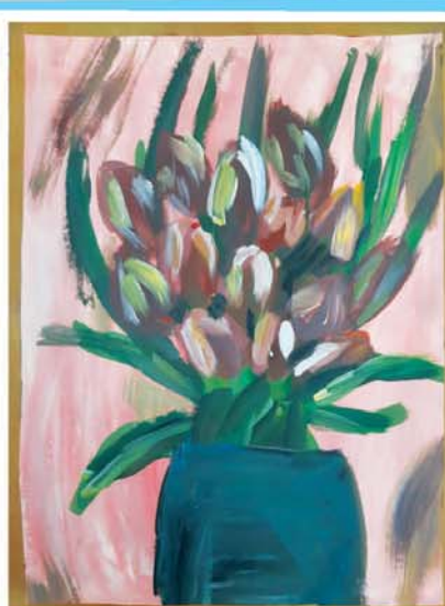
Лариана ГОНОВА, прогимназия № 66/1, г. Нальчик