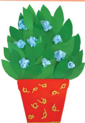
Амирхан ГОНОВ, прогимназия № 66/1, г. Нальчик