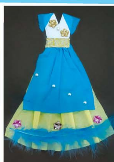
Элина АКАЕВА, прогимназия № 66/1, г. Нальчик