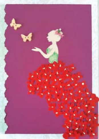
Азалия КУДАЕВА, прогимназия № 66/1, г. Нальчик