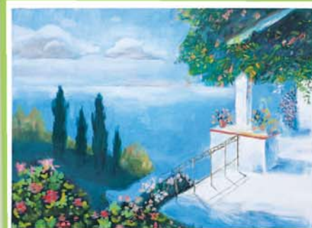
Эвелина ОГУРЛУЕВА, 6 «Б» кл., СОШ № 9, г. Нальчик