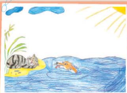
Милана ЖАМУРЗОВА, 2-й кл., прогимназия № 66/1, г. Нальчик