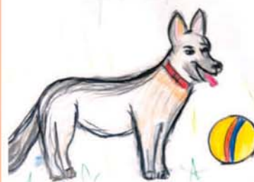
Умар МАТУЕВ, 2-й кл., прогимназия № 66/1, г. Нальчик