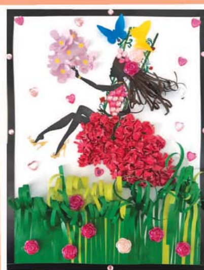
Ибрагим УМАРОВ, прогимназия № 66/1, г. Нальчик