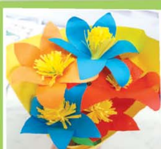
Камила АБАЗОВА, прогимназия № 66/1, г. Нальчик