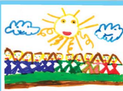
Катя ПОГОРЕЛОВА, 6 лет