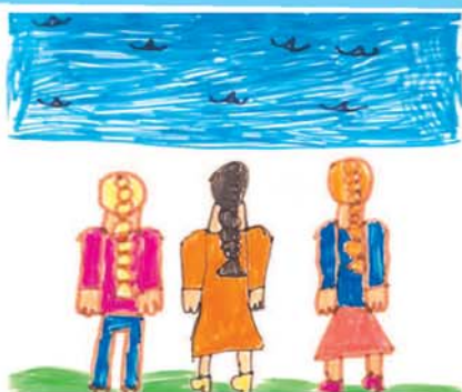
Лина БАВОКОВА, 7 лет, СОШ № 2, г. Нальчик