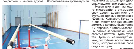
Расау ГУРТУЕВ.