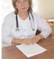
Аушигерцы тогда попросили Казбека Валерьевича оказать содействие в строительстве новой врачебной амбулатории, поскольку действующая находится в здании 1938 года постройки. Да ещё так совпало, что в стране была инициирована новая государственная программа модернизации первичного звена здравоохранения в регионах в рамках национального проекта «Здравоохранение», направленная в первую очередь на обеспечение доступности медицинской помощи для жителей малых населённых пунктов и отдалённых территорий.

Рабочая поездка Главы Кабардино-Балкарии Казбека Кокова в сельское поселение Аушигер в 2019 году оказалась для сельчан более чем удачной.