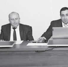
Отделение РДКБ на 20 коек.

Об особенностях работы в условиях централизованной системы рассказали специалисты онкологического диспансера, которые с цифрами и фактами объяснили преимущества централизации.