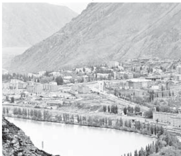
Посёлок Нижний Баксан (ныне город Тырныауз)