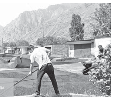
Жильё и городская среда

Национальные проекты направлены на обеспечение прорывного научно-технологического и социально-экономического развития России, повышение уровня жизни, создание условий и возможностей для самореализации и раскрытия таланта каждого человека. Они реализуются и в Эльбурском районе.