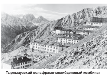
Тырныаузский вольфрамо-молибденовый комбинат

источнику вольфрама и молибдена. ТМVK был взорван, а оставшиеся концентрат и работников комбината эвакуировали через перевалы Донгуз Орун и Бечо. В начале января 1943 г. Эльбрусский район был освобождён от врагов. В 1944 году балкарское население района было депортировано в Казахстан и Киргизию. Часть Эльбурского района (Приэльбурье) передана в Верхне-Сванетский район Грузинской ССР. После возвращения балкарцев на родину и восстановления КБАССР в 1957 году изъятые земли были возвращены району.