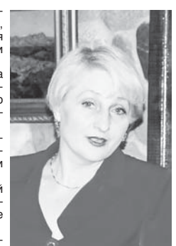
Нотариальное сообщество Кабардино-Балкарской Республики

Светлая память о нашей коллеге навсегда сохранится в наших сердцах.