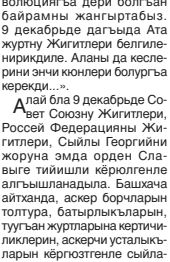
СӨЗ ЮЧЮН, ОГАВРЫ ЧЕГЕМДЕН КЕЛЕМЕТЛАНЫ КЫШАУ