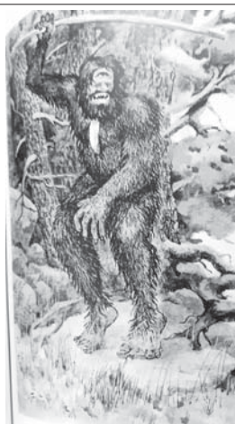
сыйлы кыулукчусу, белгили художник Тамбийланы Бурхан этгенди.

Китап аламан суратладан толуду. Аланы психология илмуланы доктору, Россейни бийик профессионал билим беруиюно сыйлы ишчиси, Кырачай-Черкеси илмусуну