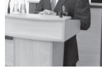
Төбөрге эркичлик берилгенди.

Жер-жерли власть органды да кытылыкка кырма мадарла тамамалдыла, ол санда муниципал иешиде ырыкыны (ол санда жери) арендага алган предпринимательге себеплик этилди. Кырал иешиде болган молноу арендага алган гиче эм орталык предпринимателерге ахчаны болжандан кеч