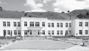
Тапандырыуу ишле ючюн «Экстрасервис» ООО жууадыла. Ол алыны болжандан алга тындырыу умтулду. Битен бу жумушлагъа 2 миллион 313 сом кыратылдыкты.