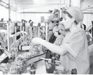
окурда алчыла болгъанлай келгенлерин да белгилерчады. Быйтыр жарашдырыуучу предпринимателер тархат кёгетледен 328 миллион банка чыгаргандыла. Быйыл а алыны саны 350 миллионга жеттир мурталдыла.

Саулай айтханда, бусагъатда республикада онеки консерва завод иштейди. Талай айтханда, ичинде ала Шимал-Кавказ федерал