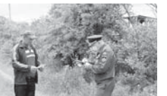
кюйдюрууге тийишчилди. Эл мюк ишлери бардырганда абаданла, гитчеле да от тошерине сак болуурга керкедиле, солуындадан сора отну ахарына дери ёнютмө кетере, тютюннени, сиркенлени атып кыюрга жарамайды. Отну кесленин ючлери была ёнютпалмай эселе, мычмай энци службага билдирге керкиди, дейдиле инспектора.

Кыйын болумланы азайтыр мурдат Управленийны Урван районда надзор эм профилактика этуу жаны была бөлмюно инспекторлары, «Кри-