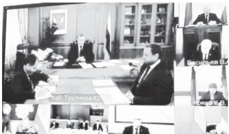
Къытышмуну юсюнден келишимле тилгенденди. Аладан бири регионлагу оноу этюну эки арасын къырауду. Округну субъекттерине «Цифралы команда» къураганды. «Цифралы амала социал экономика айныуу терлендиргери эмда оноучулары ишлерин ачыкъ этгерге бла коррупцияны азайтырга ач берилдикле» дегенди толтуруди. Ол округну субъекттерине ай-

РФ-ни Правительствосуну Председатели орунбасары – РФ-ни Президентини Узакъ Восток федерал округда толун эркинлик келечиси Юрий Трутнев, Шимал Кавказын айныуна алап, видеоконференция халда кенгеш бардырганды. Анга къырал башчыны СКФО-да толун эркинлик келечиси Юрий Чайка, Шимал-Кавказ федерал округну субъекттерини оноучулары, ол санда Къыр-Малк Республикасы Кенгеш Коков да, кытышханды. Кезгеш Шимал Кавказда къырал оноуну къыйматын кетюрююну, регионну айныуна, анга чырмау этген сылтаулары, алааны кетериюно юслеринден барганды сөз. Анда Юрий Чайка СКФО-да биринчи айында ишени эселерин тура этгенди. Ол айтканга кер, РФ-ни Правительствосуну таматасы Михаил Мишустин бла кере бардырдымдг тобушеле баш борча эмда Правительство къырауу эмда тийишли министрстволаны башчылары бла бирге ишлеуу нызамы да белгиленигенди.