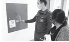
техника амалларына багга бирчеге болушук.

Андан сора инспектора ол тошенин юсюнде билдирген сигнализация системана кылай ишленгени, оту ёнютпөн устройствода бузуккыла болгандарына была кылагандарына кыраганды. Медицина персоналны была саусузына болындадан чыгаруу планына энци эс бурганды. Ахырында учреждениян башчылары была ишчилерине кюе турган меккамда чыгауу жорукларын анылаткандыла, эсгертиле юлешкенди.