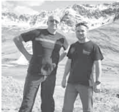
аш-суулары бла шагъарейлендиргенди. Эпидемиология болум тюзелсе, июнну ахырында ара сахарлы квадро клубланы къатышыулары бла экспедициягъа чыгъаргъа мурат да барды.

Анга внедорожникледге, квадроциклледге чыгъаргъа жарагъанды, жолоучулукъну кезиуонде уа къонакълагъа андагы жерлени юслеринден сейирлик хапарла айтылгъандыла, тарых эм маданият эсгертмеле кёргозюлгенди, Кавказны халкъларыны тёрелери,