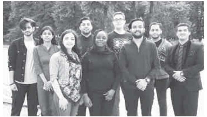
Бизни студентлерибиз бу акциягъа суююп къатышхандыла», - дегенди университетни студент шахарчыгъыны тыш къыраллы студентлени ишле-

Адабият флешмоб къурап, тыш къыраллы студентле да бу эсгеруу акциягъа тири къатышхандыла. Индияны, Палестинаны, Сирияны, Нигерияны, Йеменни эм Афганистанны келечилери «Къууанч эм насып сизге, саула!» деген назмуну окъугандыла. «Кёп тыш къыралада Къулийланы Къайсынны чыгъармачылыгын биледеди эм суюдиле. Ала 140-дан аслам тилге кёчюрюлгендиге. Аны Ата журтха, адамлагъа, суюмекликден толду тизгинлери кёп адамлары кесине жууукълашдырадыла. Аны себепли