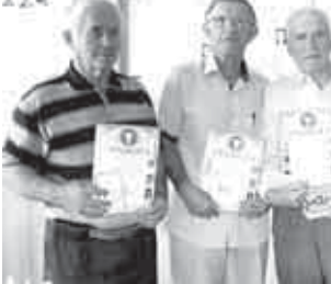
Юч жылны совет аскерчилини Германияда болган кыууларында артиллерист полкада тахсама болуп кылуулук этгенди.