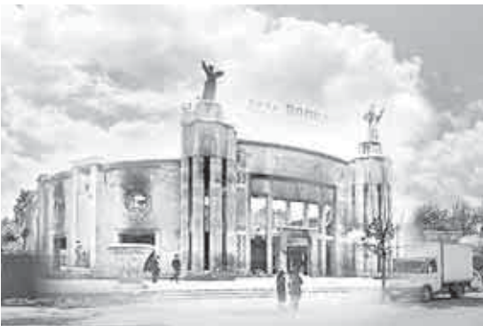
«Победа» кинотеатр уруш жыллада.

1943 жылда 11 январьда Къабарты-Малкъар бла Нальчик шахар немис-фашист ууучлаучуладан азатланнганды