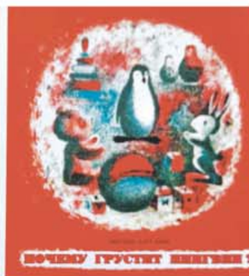
Два издания книги Юрия Крутова «Почему грустит Пингвин?»