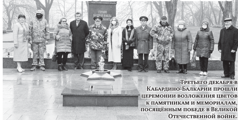
ТРЕТЬЕГО ДЕКАБРЯ В КАБАРДИНО-БАЛКАРИИ ПРОШЛИ ЦЕРЕМОНИИ ВОЗЛОЖЕНИЯ ЦВЕТОВ К ПАМЯТНИКАМ И МЕМОРИАЛАМ, ПОСВЯЩЁННЫМ ПОБЕДЕ В ВЕЛИКОЙ ОТЕЧЕСТВЕННОЙ ВОЙНЕ.

В школах и других образовательных учреждениях республики состоялись онлайн-уроки, посвящённые Дню Неизвестного солдата.