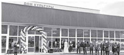
Дом культуры в селе Кенделен

Первым пунктом посещения руководитель региона стало сельское поселение Кенделен. К.В. Кокв проинспектировал автодорогу по улице Хаймашинской. Здесь проживает 120 семей и расположено одно из образовательных учреждений села. Дорога была сильно повреждена в результате ливневых дождей. По программе «Подъезды к значимым объектам и производителям сельскохозяйственной продукции» проведена реконструкция участка протяженностью 650 метров.