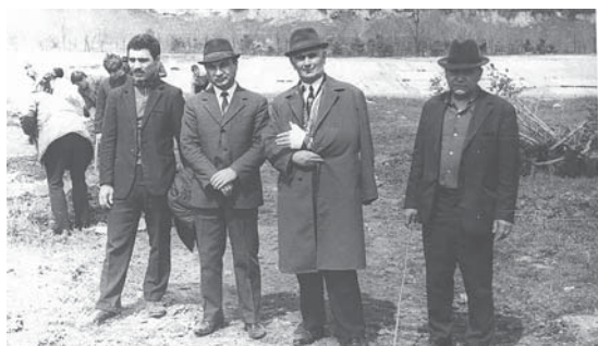
Аппарат горкома комсомола, 1974 год