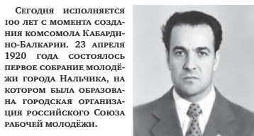
С этой даты и ведется отчет истории Кабардино-Балкарской областной организации – Всероссийского Ленинского комсомола молодежи, активисты которого участвовали в превращении в жизнь государственных планов, направленных на развитие народного хозяйства страны, подняли культуру, воспитание подрастающего поколения.

□ ДАТА Сегодня исполняется 100 лет с момента создания комсомола Кабардино-Балкарии. 23 апреля 1920 года состоялось первое собрание молодежной группы Нальчик, на котором была образована городская организация Российского Союза Рабочей Молодежи.