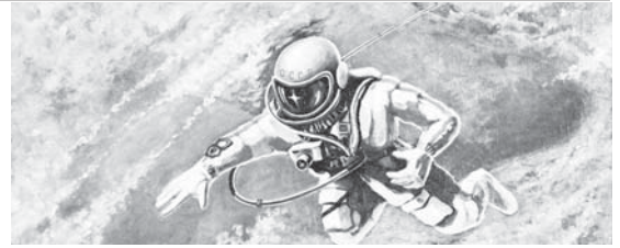
Картина Алексея Архиповича Леонова

В 1968 году в Нальчике с большим почётом принимали космо-