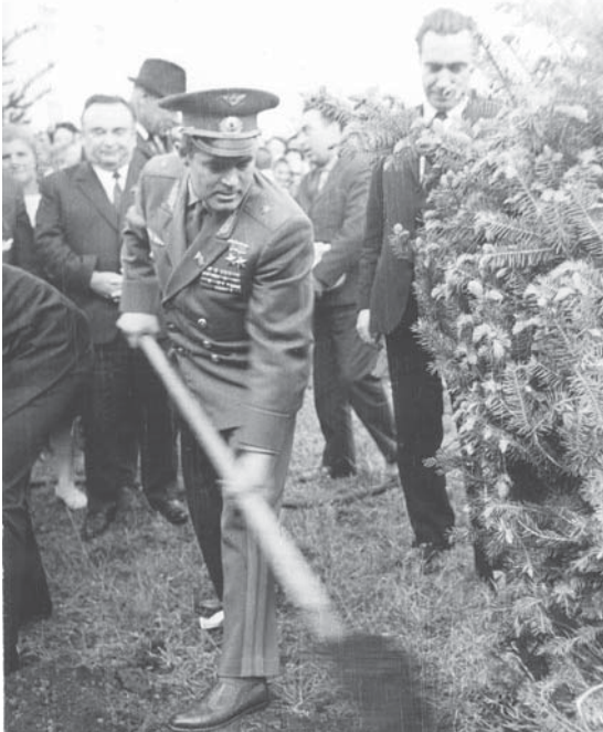
Андрей Григорьевич Николаев, 1972 г. Советский космонавт №3. Дважды Герой Советского Союза. Генерал-майор авиации. Первый космонавт, который участвовал в военном эксперименте в космосе. В ходе своего первого полёта Николаев впервые отвалился от кресла, свободно парил в корабле в невесомости.