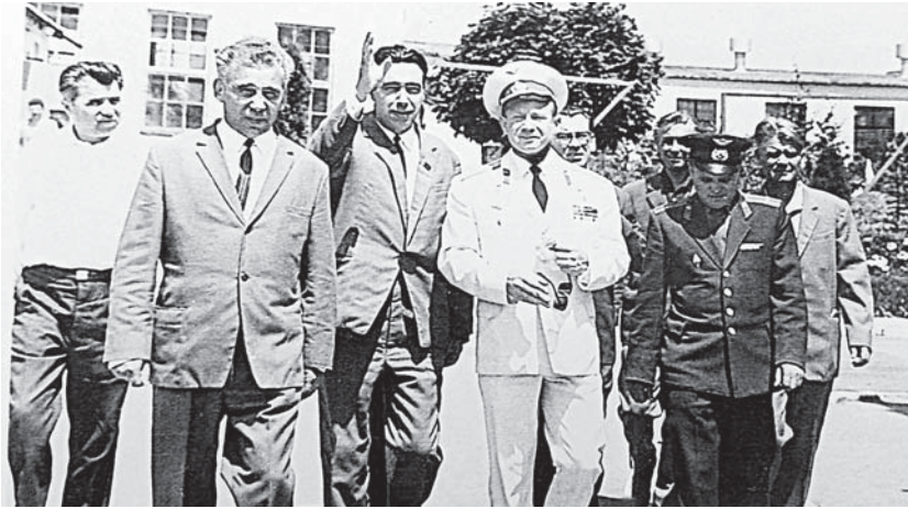
Алексей Архипович Леонов на заводе «СКЭП», 1968 г. Лётчик-космонавт СССР № 11, первый человек, вышедший в открытый космос. Дважды Герой Советского Союза, генерал-майор авиации.

12 АПРЕЛЯ 1961 ГОДА БЫЛ СОВЕРШЁН ПЕРВЫЙ ОРБИТАЛЬНЫЙ ПОЛЁТ ВОКРУГ ЗЕМЛИ, ЕГО ВЫПОЛНИЛ КОСМОНАВТ ЮРИЙ ГАГАРИН НА КОСМИЧЕСКОМ КОРАБЛЕ «ВОСТОК». С ЭТОГО СОБЫТИЯ, ПОТРЯСШЕГО ВЕСЬ МИР, НАЧАЛОСЬ ОСВОЕНИЕ КОСМОСА ЧЕЛОВЕКОМ.