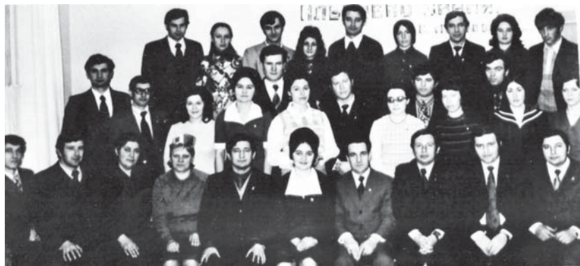
Аппарат обкома ВЛКСМ

«По многим программам мы можем составить достойную конкуренцию другим участникам, но есть у нас и ахиллесова пята, — посетовал мой собеседник. — В обязательную программу включены команды КВН, а у нас, к сожалению, сегодня нет такой конкурентоспособной команды. Значит, нам предстоит её создать, и для этого мне рекомендовали вас. Времени на подготовку максимум десять дней, затем генеральная