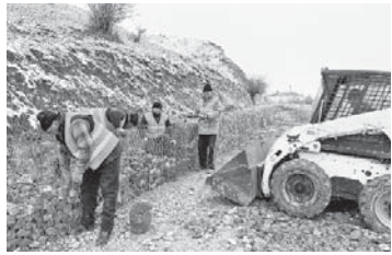
Прохладный — Баксан — Эльбрус (км 0 — км 49) в Исламе. Ведущую к курорту Эльбрус трассу А-158 (км 0 — км 104) зачищают от размывов подпорными стенами из бурожелезных свай — всего таких участков двенадцать, а на 35-м километре этой трассы в п. Беджж завершается ремонт моста через Баксан.

В 2020 году планируется завершить ранее начатый ремонт в регионе на участках трасс А-154, А-158 и Р-217 общей протяжённостью более 40 км. На всех объектах, в том числе на примыканиях и пересечениях, специалисты усилят дорожную одежду, отремонтируют водопропускные трубы и придорожные лотки. При устройстве верхнего слоя покрытия будет использован щебёночно-мастичный асфальтобетон. На участках устанавлят барьерное ограждение, габионные подпорные стены, обновят дорожные знаки и разметку. Аналогичный объём работ до конца 2021 года выполнит на восьмикилометровом участке автодороги А-158