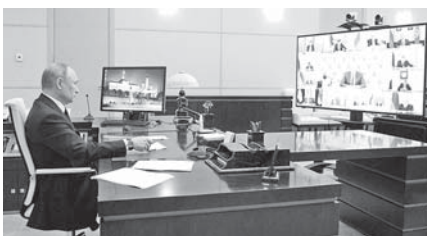
Эти цели федеральным Правительством уже заявлены необходимой финансовой поддержкой.

Неотложной задачей и безусловным приоритетом для всех регионов названа повышенная готовность медицинских учреждений, существующее наращивание их ресурсов и возможность, развертывание дополнительных специализированных ковок, закупка медицинского оборудования ИВЛ, реанимационных машин скорой помощи, формирование бригад специалистов, способных работать с новым оборудованием. На