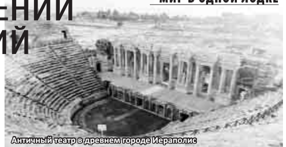
Античный театр в древнем городе Иераполис

Кухня Турции - богатейшая, вобравшая все самое лучшее у разных народов. Для россиян немного экзотичная. Так, в нашей группе была девушка, которая питалась молоком, хлебом и